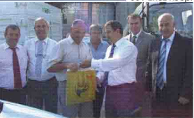
851 Enez Koop.

Yenileme kapsamında, 222 Sayılı Ipsala, ve 851 Sayılı Enez Kooperatiflerimize 3,5 ton taşıma kapasitesine sahip 470 Sayılı Silivri Kooperatifimize ise 7,5